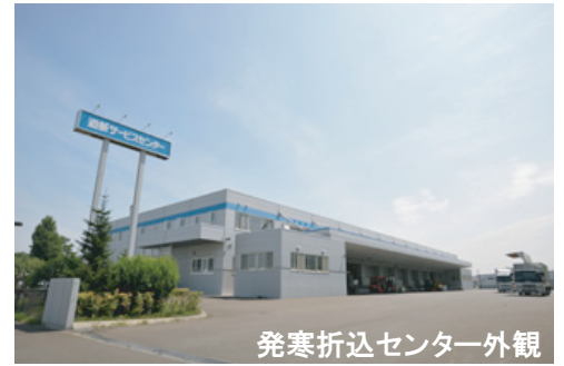
発寒折込センター外観